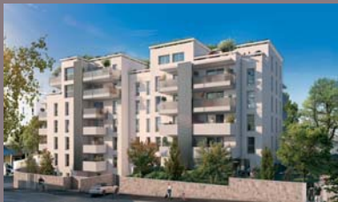
Marseille 4 e SOLANA