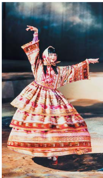
Ci-contre, Victor Weinsanto : Sans titre, Alsace, 2021. Ci-dessus, Kenzo par Kenzo Takada : robe de mariée, collection prêt-à-porter automne-hiver 1982, taffetas, rubans de jacquard, dentelle de fils métalliques.