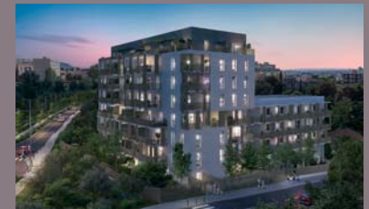
Marseille 10 e IMPULSION