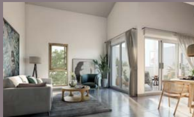
Marseille 6 e HÉRITAGE